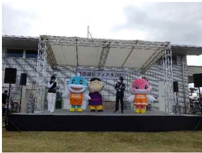
堅田湖族フェスタ2022の様子