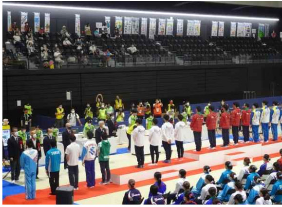
体操競技 表彰式の様子 (栃木県宇都宮市)