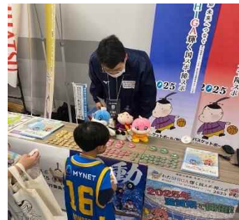
滋賀レイクス新ホームアリーナ開幕戦 (滋賀ダイハツアリーナこけら落とし)