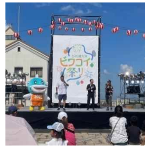
令和5年9月9日(土)、10日(日) びわこ浜大津ピワコイ祭りでの PR 広報活動の様子