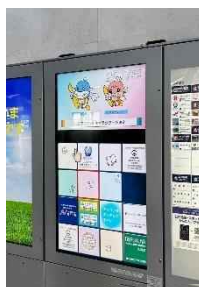
大津市役所 新館ほか