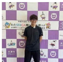
陸上走高跳パリオリンピック強化指定選手 瀬古 優斗 選手