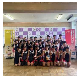
大津市立瀬田北中学校ボート部

11月15日現在、Instagramの投稿数77投稿、フォロワー数630人 (X、Facebookに関してはInstagramと連携)