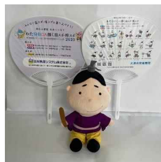
日本熱源システム株式会社様 うちわ