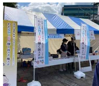
出店したイベントでの活用