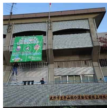
皇子山総合運動公園陸上競技場