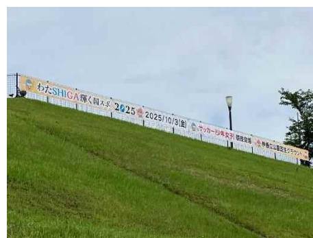
伊香立公園芝生グラウンド