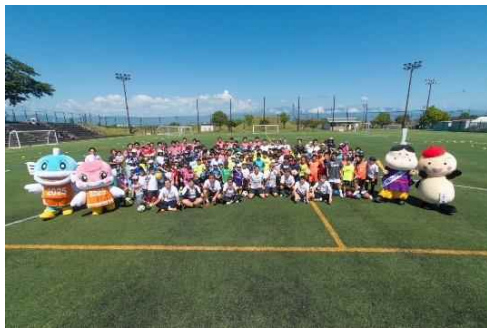
「わた SHIGA 輝く国スポ・障スポ」 777日前イベントの様子 (場所：野洲川歴史公園サッカー場)