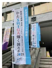
大津市役所 正面玄関