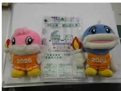
松田クリーンパック様 大津市指定家庭ごみ袋 (45ℓ) 10枚1セット×600セット