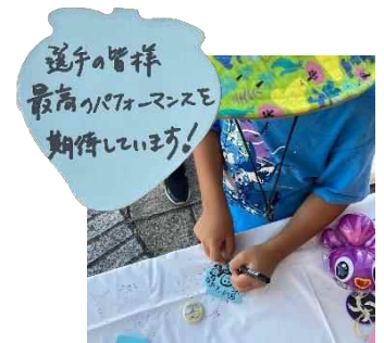
大会応援メッセージ の募集