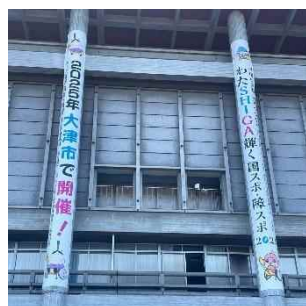
大津市役所 正面玄関