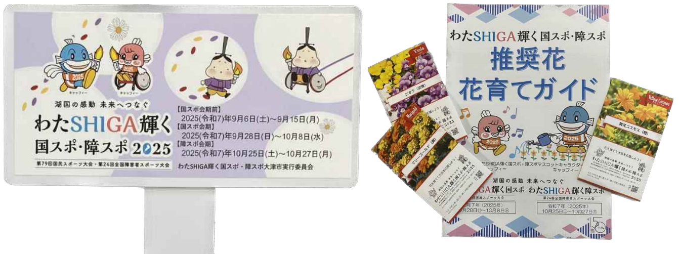
わたSHIGA輝く国スポ・障スポPRガーデンピック

(5) 令和5年8月中旬には、大津市内の花育て団体に、わたSHIGA輝く国スポ・障スポPRガーデンピックを配布した。(106団体)