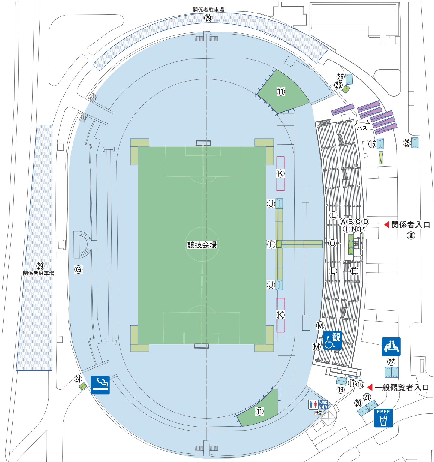
会場・3階スタンド配置図