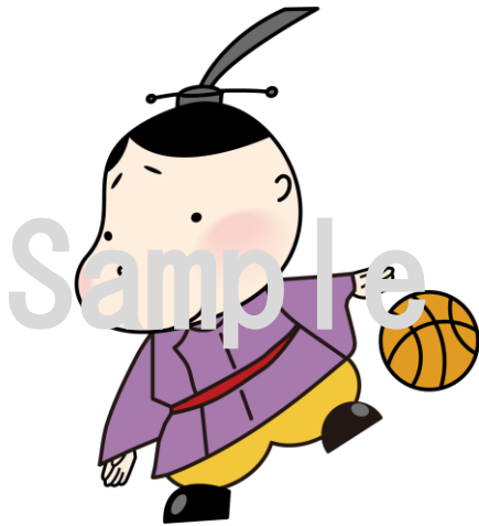
No.19 バスケットボール (知)