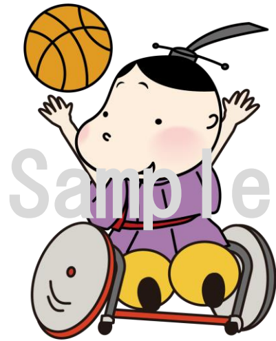
No.20 車いすバスケットボール (身)