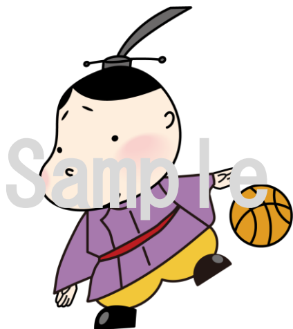
No.7 バスケットボール