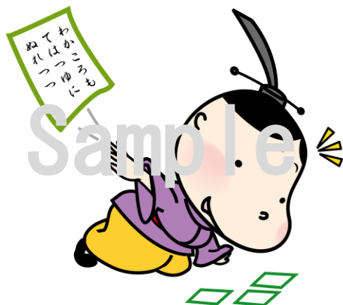
No.17 小倉百人一首競技かるた