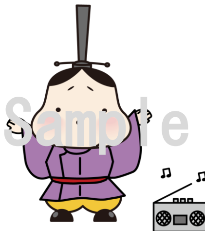
No.16 ラジオ体操第3（初代・二代目）