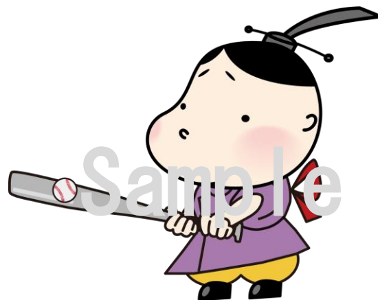
No.14 高等学校野球（硬式）