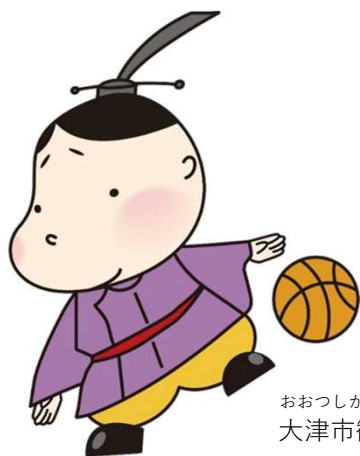
おおつしかんこう 大津市観光キャラクター 「おおつ光ルくん」